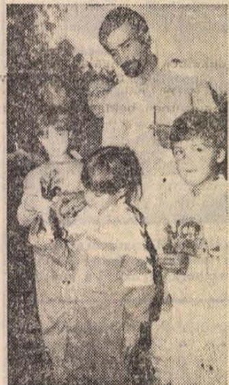
Erdőkertesen felnőttek, gyerekek gyertyával és virággal tisztelegtek az elhunytak előtt

Gödön tegnap délután a Kossuth-szobor előtt idézték fel a harminchárom évvel ezelőtti eseményeket. Bár elhangzott néhány keményebb megjegyzés, a hangulat békeségére jellemző, hogy a szónoktól pár lépésre egy aprócska lány színes őszi leveleket gyűjtött. Ezután a résztvevők a Münnich Ferenc utcához vonultak, ahol az eredeti táblát a Nagy Imre utca és a szentkoronával díszített feliratúra cserélték