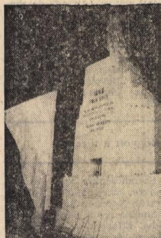
A dunaharasztiak első világháborús emlékművénél virágokat helyeztek el '56 áldozatainak tiszteletére

Az emléktábla-avatás után ünnepi szentmisét mutatott be