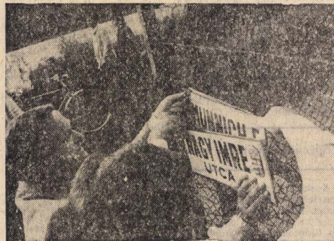
Utcanévtábla-csere Gödön: Münnich Ferenc helyett Nagy Imre